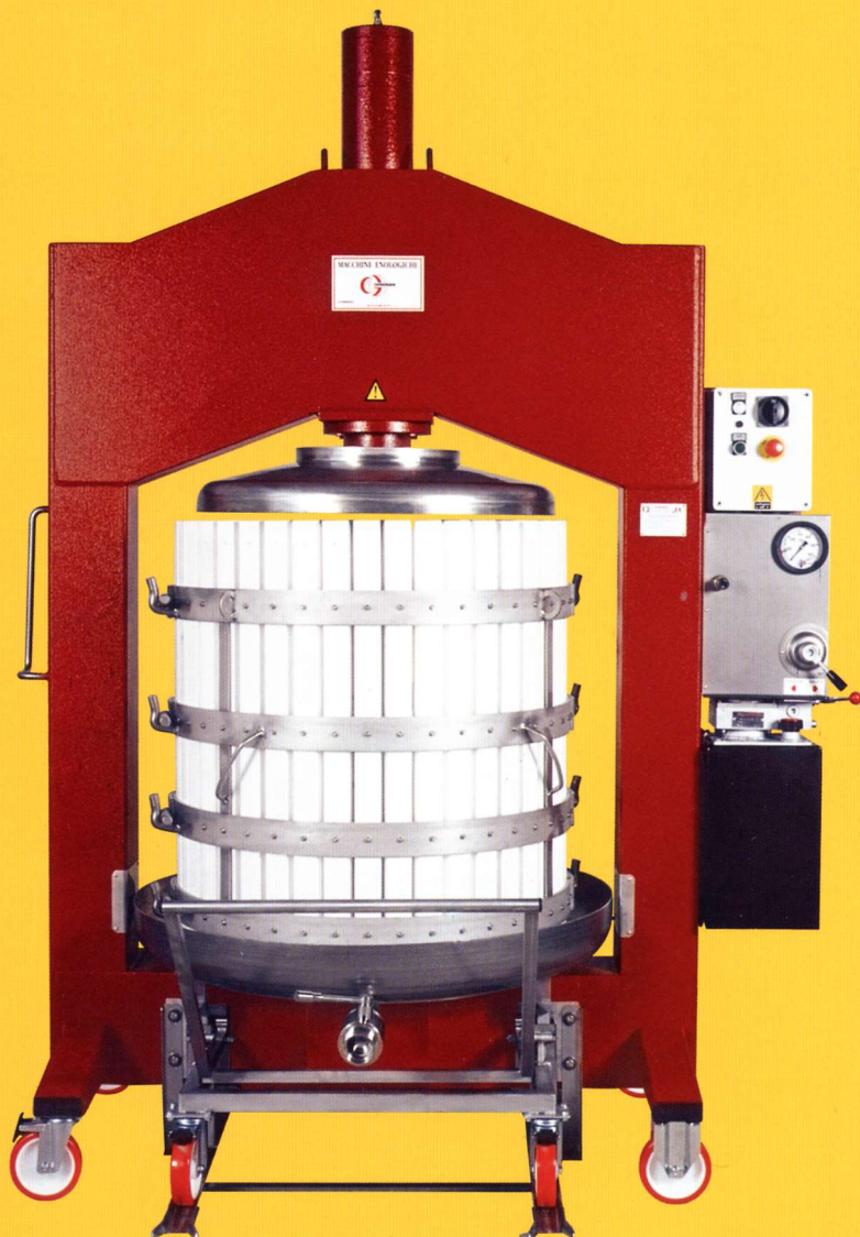
Versione con listelli della gabbia in polietilene