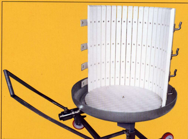
Gabbia con listelli e drenaggio in polietilene