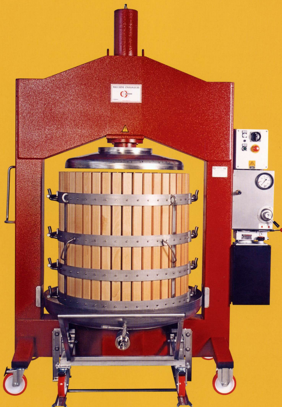
Tipo 2 INOX V su ruote