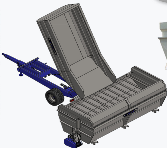
Châssis Elévateur STHIK