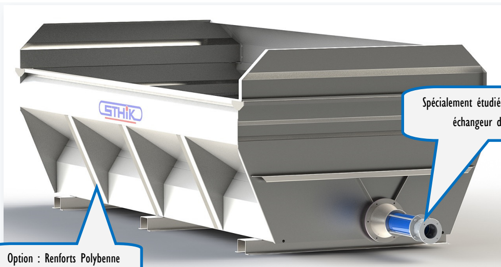
Option : Renforts Polybenne

Spécialement étudiés pour réception avec échangeur de température