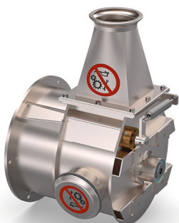
Pompe à Ogive CMA 25-30 T/H