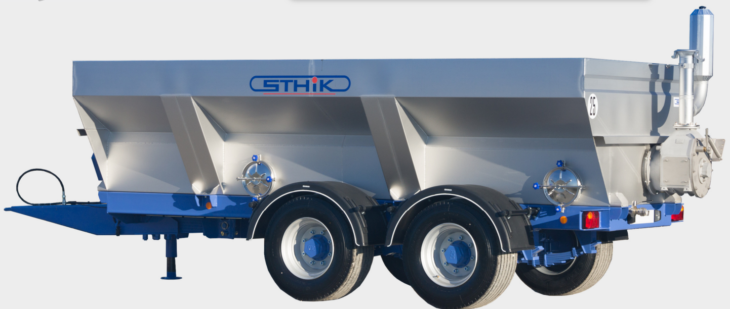
FBP 120 Caisson Egouttage-Stockage