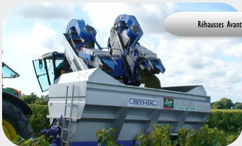
Réhausses Avant & Arrière